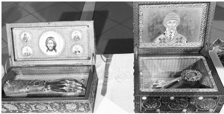
Ковчег с частицами мощей Спиридона Тримифунтского.