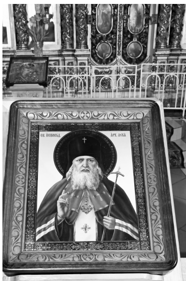
Икона святителя Луки Крымского.

общецерковного почитания. В своих молитвах к Святому Луке обращаются представители медицинских профессий, особенно хирурги, над которыми Святой взял небесное покровительство. Молятся ему и люди, обремененные различными недугами, те, кто ожидает операции.