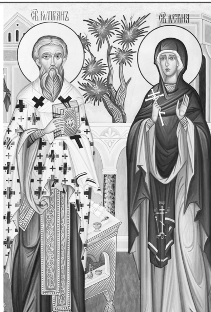
Икона Святых Киприана и Иустинии.

Величайший из Святых — Лука Крымский, в миру Валентин Феликсович Войно — Ясенецкий — русский врач и хирург, профессор медицины и духовный писатель. В 2000 году был канонизирован Русской православной церковью в сонме новомучеников и исповедников Российских для